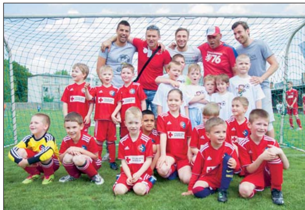
NEJVĚTŠÍ ODMĚNOU pro děti z fotbalového kroužku při Mateřské škole na ulici Zelené bylo setkání a společné focení s legendou ostravského fotbalu Milanem Barošem.